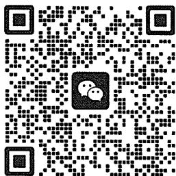
群聊：《经济法》课程各联盟高校领队群