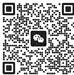
群聊：《经济法》课程参赛选手群